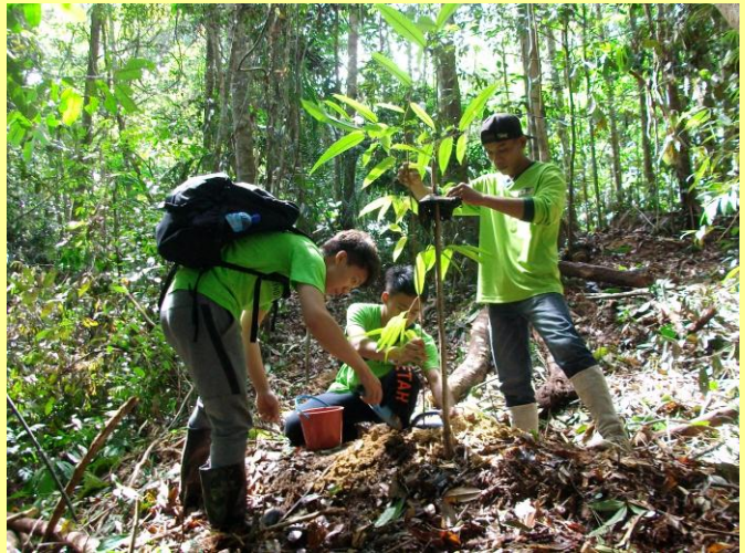
木下グループの方々と共に植林作業体験(平成29年8月)