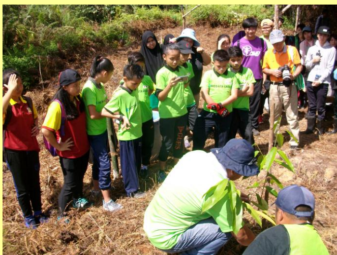
マレーシア・サラワク大学教員が森林保全の意義について講話(左) 植林方法について説明を受ける小学生(右)(平成30年3月)