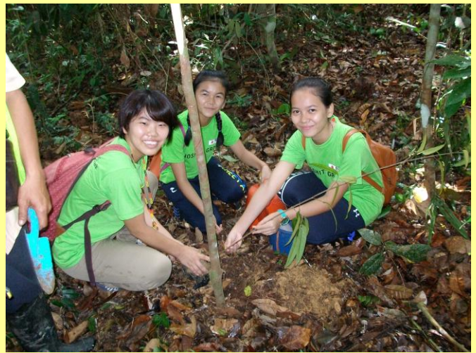
「木下の森」青少年研修プログラムに参加 地域の中高生らと植林作業(平成29年8月)