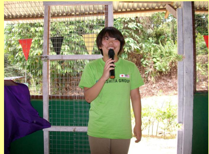
植林作業後、感想を述べる(平成29年8月)