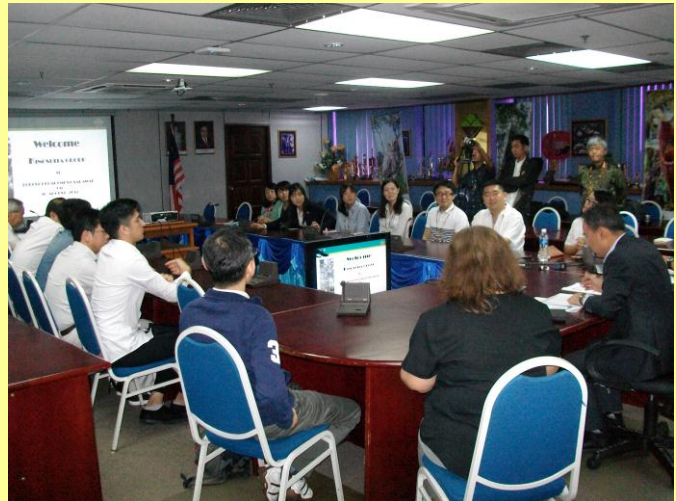
木下グループの方々とサラワク州森林局訪問 (平成29年8月)