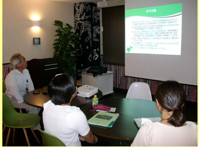
都内で事前研修会(平成29年7月)