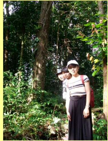
マレーシア・サラワク大学訪問(左)、ランデ保護林訪問(右)(平成29年8月)