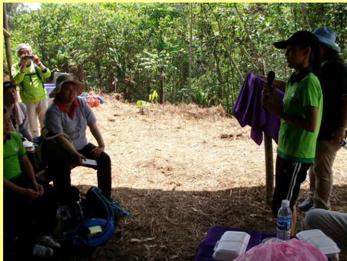
植林作業後、感想を語り合う 中高生(左)、小学生(右) (平成30年3月)