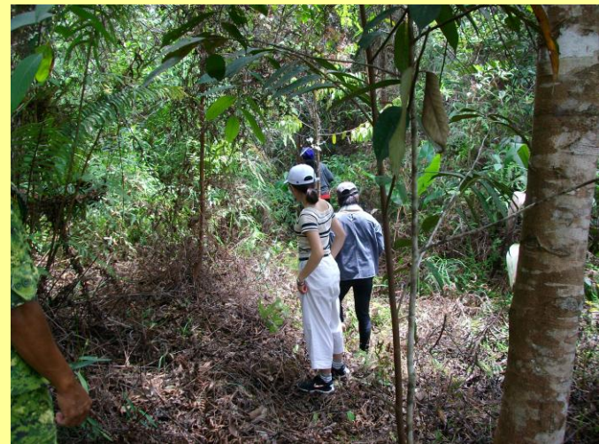
「木下の森」活動地でメンテナンス作業を体験 (平成29年8月)