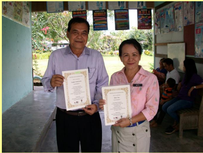
感想文を提出したバイリンギン中高生へ記念品贈呈 クライト小学校教員へ参加証贈呈(平成29年11月)