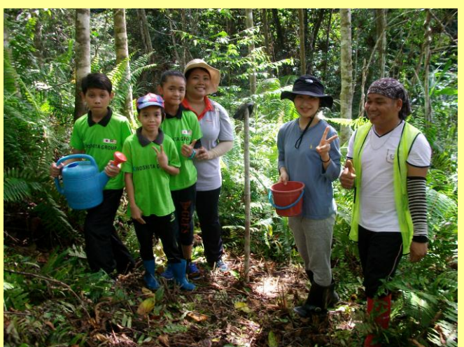
植林体験をする児童たち(平成30年3月)