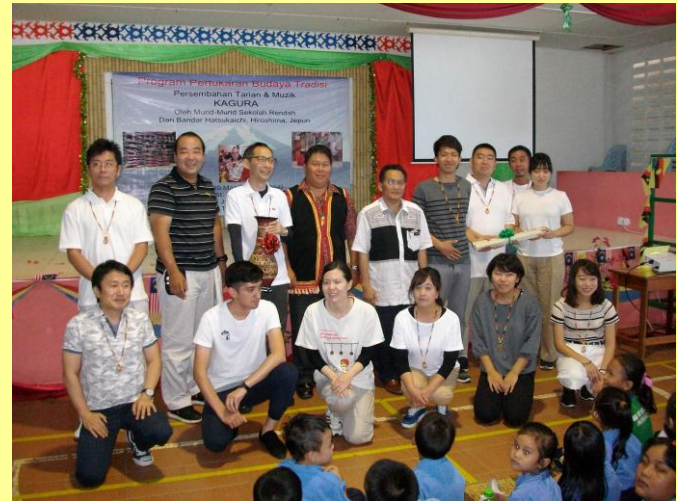
木下グループの方々とセント・ノバート小学校を訪問し交流 (平成29年8月)