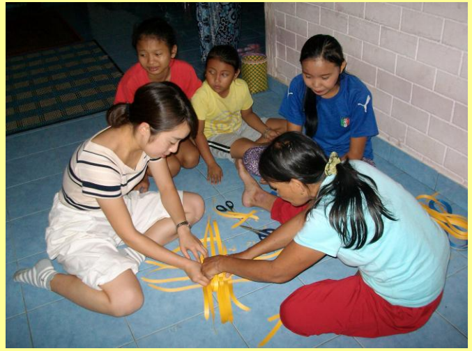
トン・ニボン村の農園で作業体験(左) 村の女性から編み籠づくりを習う(右)(平成29年8月)