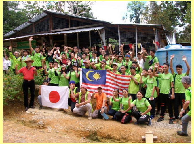
植林活動について意見交換(左) 参加者全員で(右) (平成29年8月)