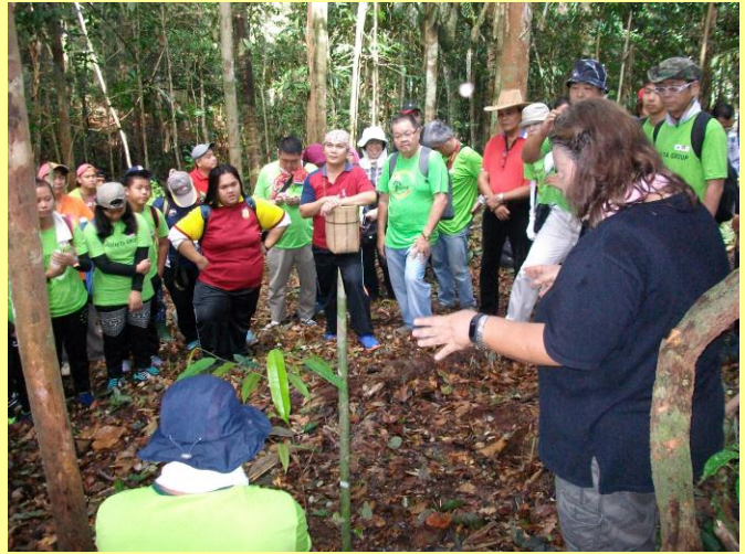
植林活動の説明を受ける(平成29年8月)