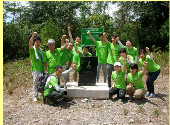
「木下の森」モニュメントの前で木下グループの方々と (平成29年8月)