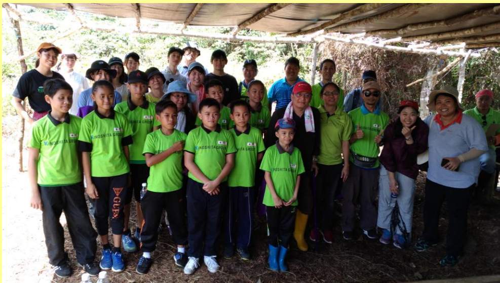
参加者全員で (平成30年3月)